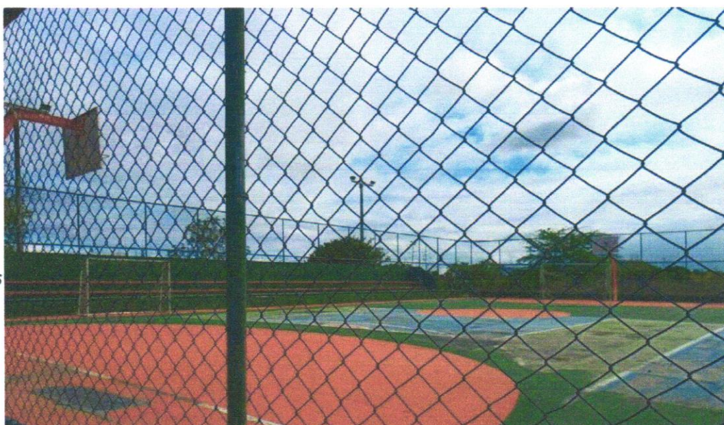
Foto 06 - Traves oficial para futebol de salão 3x2m em aço galv.3", com requadro e redes de polietileno fio 4mm (conjunto p/futsal)