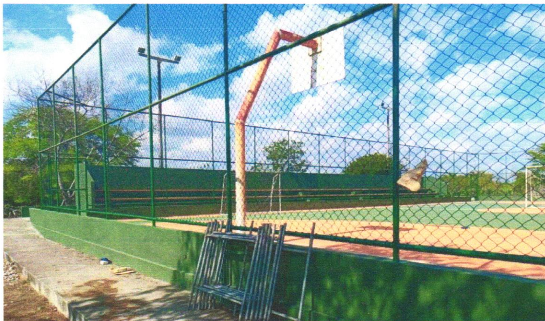
Foto 05 - ALAMBRADO PARA QUADRA POLIESPORTIVA, ESTRUTURADO POR TUBOS DE AÇO GALVANIZADO, (MONTANTES COM DIÂMETRO 2", TRAVESSAS E ESCORAS COM DIÂMETRO 1 ¼), COM TELA DE ARAME GALVANIZADO, FIO 10 BWG E MALHA QUADRADA 5X5CM (EXCETO MURETA). AF_03/2021