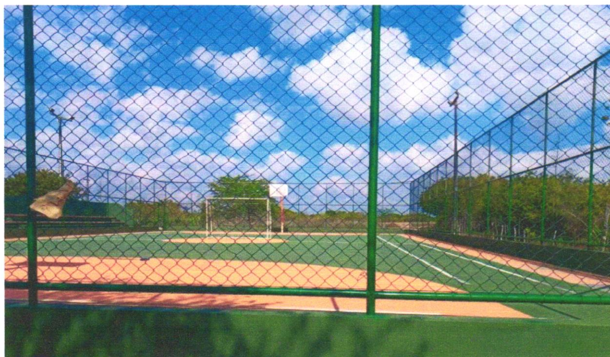
Foto 04- ALAMBRADO PARA QUADRA POLIESPORTIVA, ESTRUTURADO POR TUBOS DE AÇO GALVANIZADO, (MONTANTES COM DIÂMETRO 2", TRAVESSAS E ESCORAS COM DIÂMETRO 1 1/4), COM TELA DE ARAME GALVANIZADO, FIO 10 BWG E MALHA QUADRADA 5X5CM (EXCETO MURETA). AF_03/2021