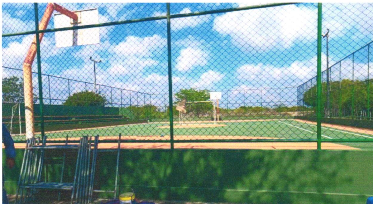
Foto 03 – ACABAMENTO POLIDO PARA PISO DE CONCRETO ARMADO DE ALTA RESISTÊNCIA. AF_09/2017